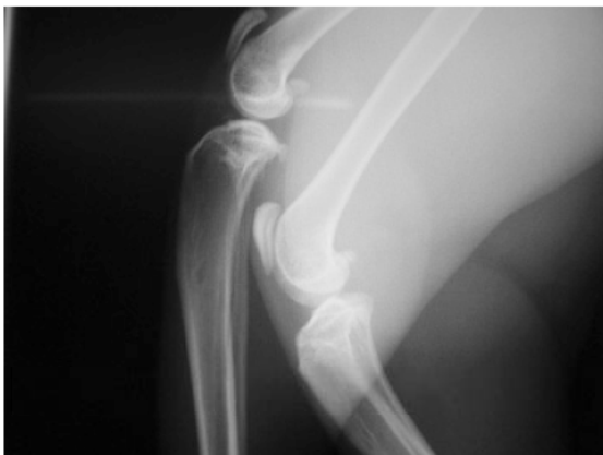
図2 X線ラテラル像 離断性骨軟骨症 (症例2)