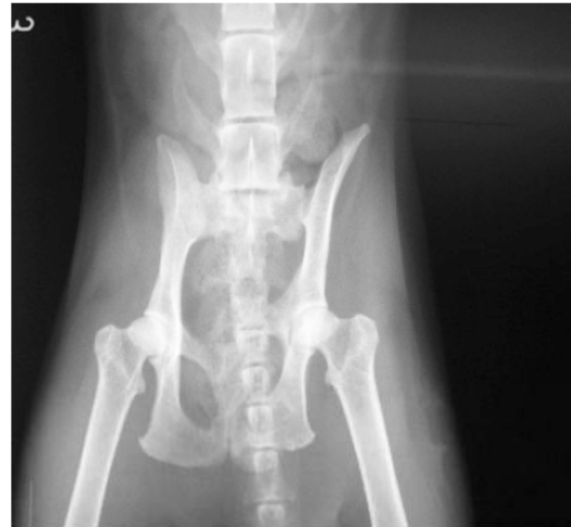
図3 X線VD像 骨盤骨折 (症例3)