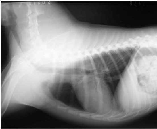
図1 X線ラテラル像 気管虚脱 (症例1)